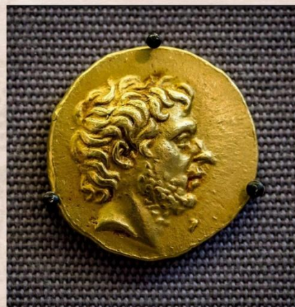
TIT KVINCIIJA FLAMININA

IZ ZAČETEK 2.STOL JE ZNAJ KOVENEC, KI ODRAŽA VLADARSKO PRIČESKO